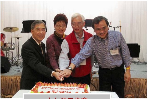
十七週年堂慶 崇拜（於基石宣道會）及聚餐